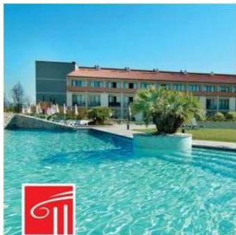
Il Park Hotel di Peschiera del Garda, base logistica delle Giornate Europee