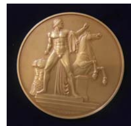
La medaglia della Presidenza della Repubblica